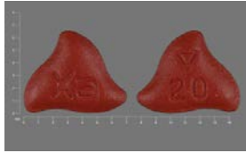
أقراص زارلتو 20 مجم