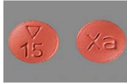
أقراص زارلتو 15 مجم