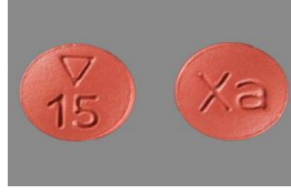
أقراص زارلتو 15 مجم