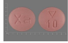
أقراص زارلتو 10 مجم