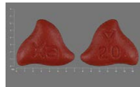
利伐沙班 20 毫克药片