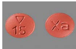
利伐沙班 15 毫克药片